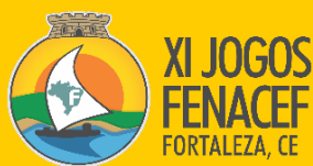
TABELA DE COMPETIÇÃO FUTSAL Série Amarela