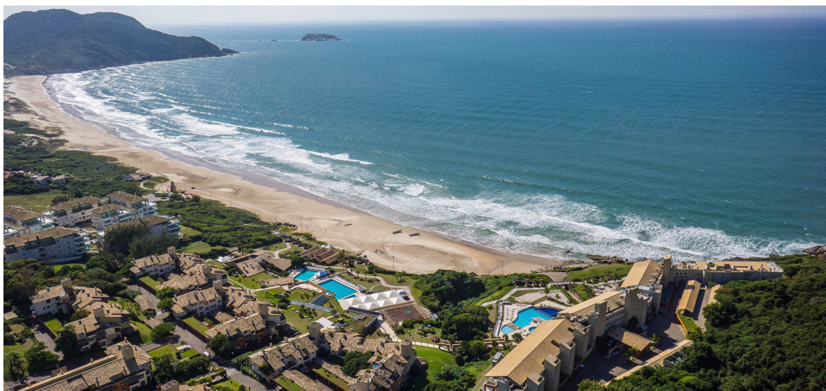
Vista aérea da Praia do Santinho

Em caso de dúvidas, contate as empresas organizadoras, É Fato Comunicação e Felinni Events , pelo telefone 51 99225.5930 ou e-mail simposiofenacef2022@felinievents.com.br .