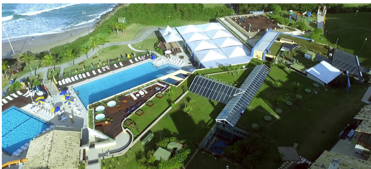
Vista aérea do Costão do Santinho

Neste primeiro informativo, você encontrará informações primordiais que irão ajudá-lo na elaboração e na divulgação dos pacotes destinados aos associados da AEA que preside.