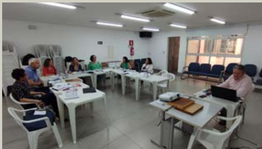
Diretoria reunida para o desenvolvimento do Planejamento Estratégico da AEAMG

Nesse processo, cinco objetivos estratégicos foram estabelecidos, todos eles direcionados para o fortalecimento da relação associativa. Essas metas exigirão maior empenho de cada membro da Diretoria Executiva, bem como a participação ativa do Conselho Deliberativo e Fiscal.