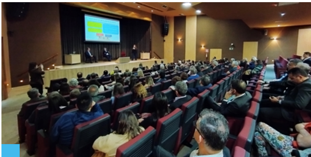
Plateia lotada durante o evento 'Debatendo FUNCEF', organizado em parceria pela APCEF-MG, AGECEF e AEAMG, no auditório da AMMG

No dia 26 de junho, a APCEF-MG, a AGECEF e a AEAMG, uniram-se para realizar um evento de grande importância para todos que estão vinculados à FUNCEF, incluindo tanto os empregados da CAIXA, que estão construindo seu patrimônio para a iminente aposentadoria, quanto aqueles que já se encontram na fase de recebimento do benefício.